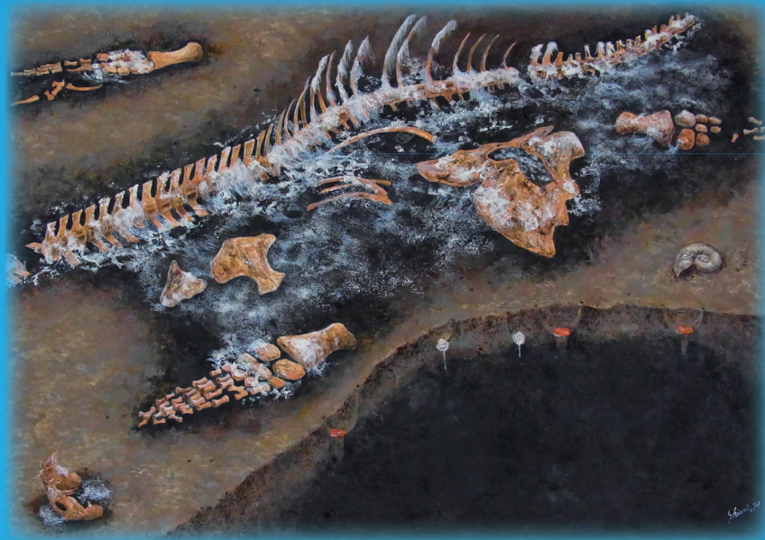
竜骨群集の復元画（画：堀江葉）