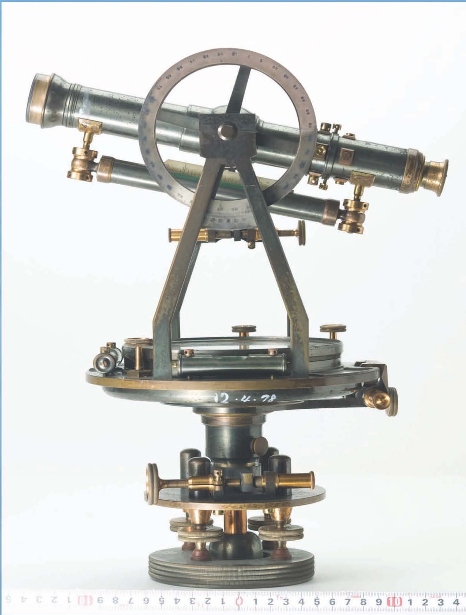
経緯儀（重学302） 金沢大学資料館所蔵